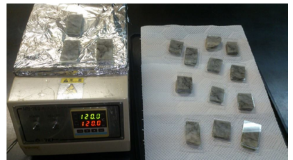
岩石を切って磨き、ガラスに貼り付けているところです。ガラスは28mm×48mmです。